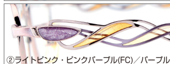
②ライトピンク・ピンクパープル(FC)/パープル