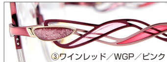
③ワインレッド/WGP/ピンク