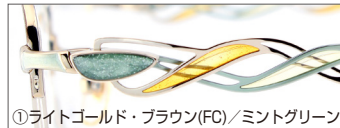
①ライトゴールド・ブラウン(FC)/ミントグリーン