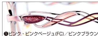
①ピンク・ピンクベージュ(FC)/ピンクブラウン