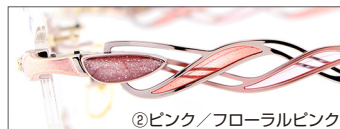
②ピンク/フローラルピンク