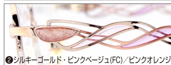
②シルキーゴールド・ピンクベージュ(FC)/ピンクオレンジ