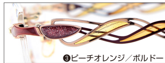
②ピーチオレンジ/ボルドー